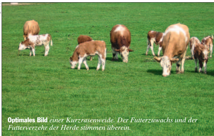
Optimales Bild einer Kurzrasenweide. Der Futterzuwachs und der Futterverzehr der Herde stimmen überein.