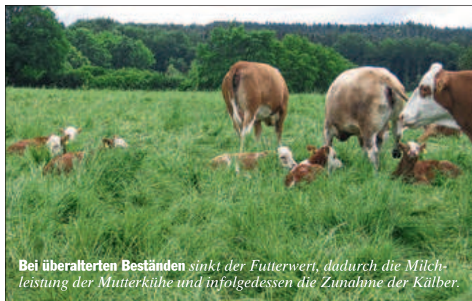
Bei überalterten Beständen sinkt der Futterwert, dadurch die Milchleistung der Mutterkühe und infolgedessen die Zunahme der Kälber.

Die Weidehaltung von Mutterkühen ist ein übliches Verfahren. In der Praxis gibt es allerdings verschiedene Systeme – einige davon sind jedoch mit hohem Material- und Pflegeaufwand verbunden. Die LfL Bayern untersuchte dazu die Wirtschaftlichkeit von Kurzrasenweide in Kombination mit Winterkalbung.